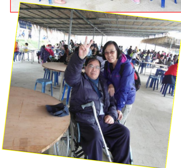
《南生圍觀鳥生態遊》收支